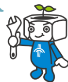
新潟工科大学キャラクター つくっ太郎