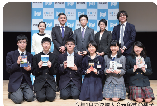
今年1月の決勝大会表彰式の様子