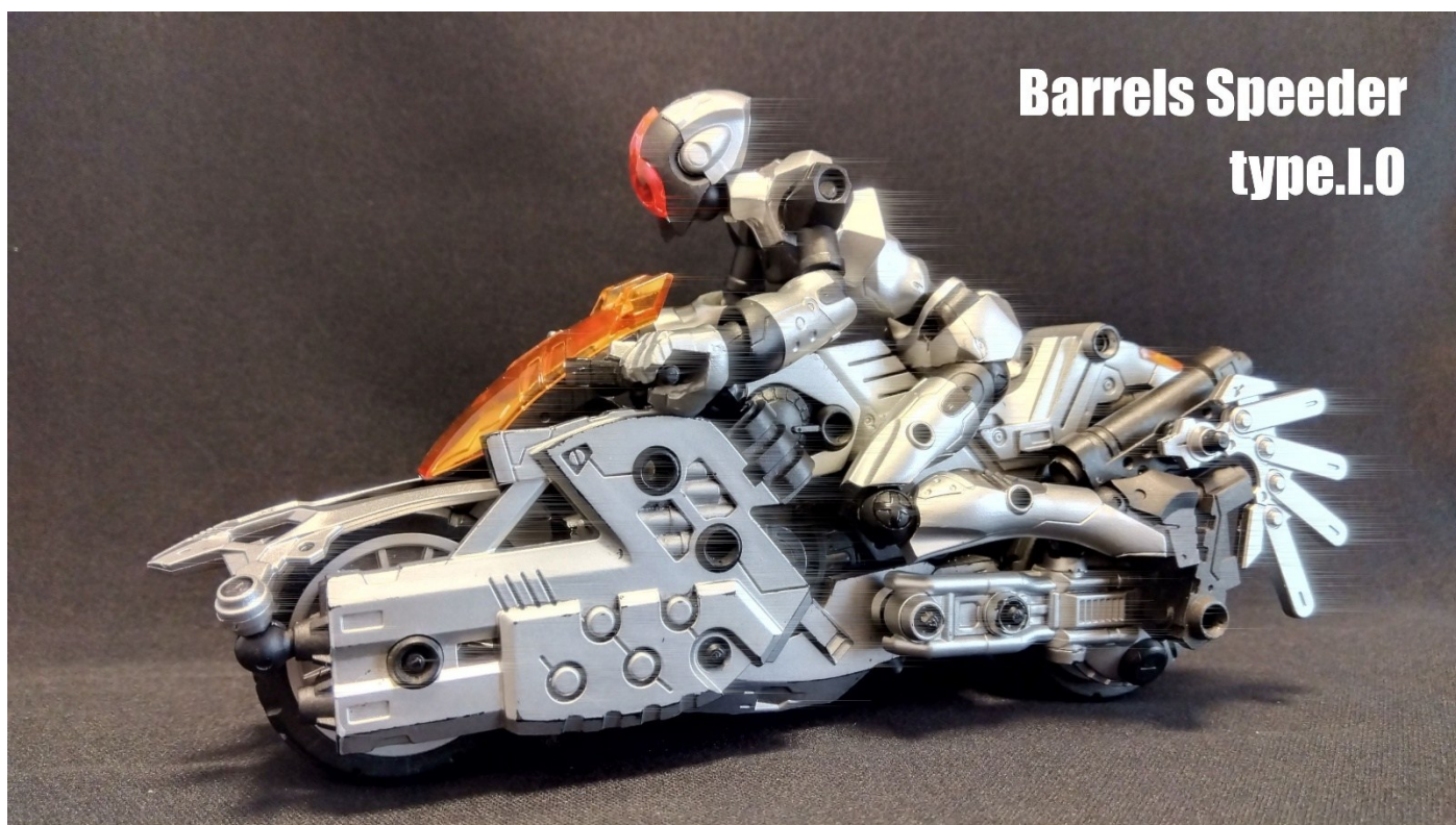
Barrels Speeder type.I.O