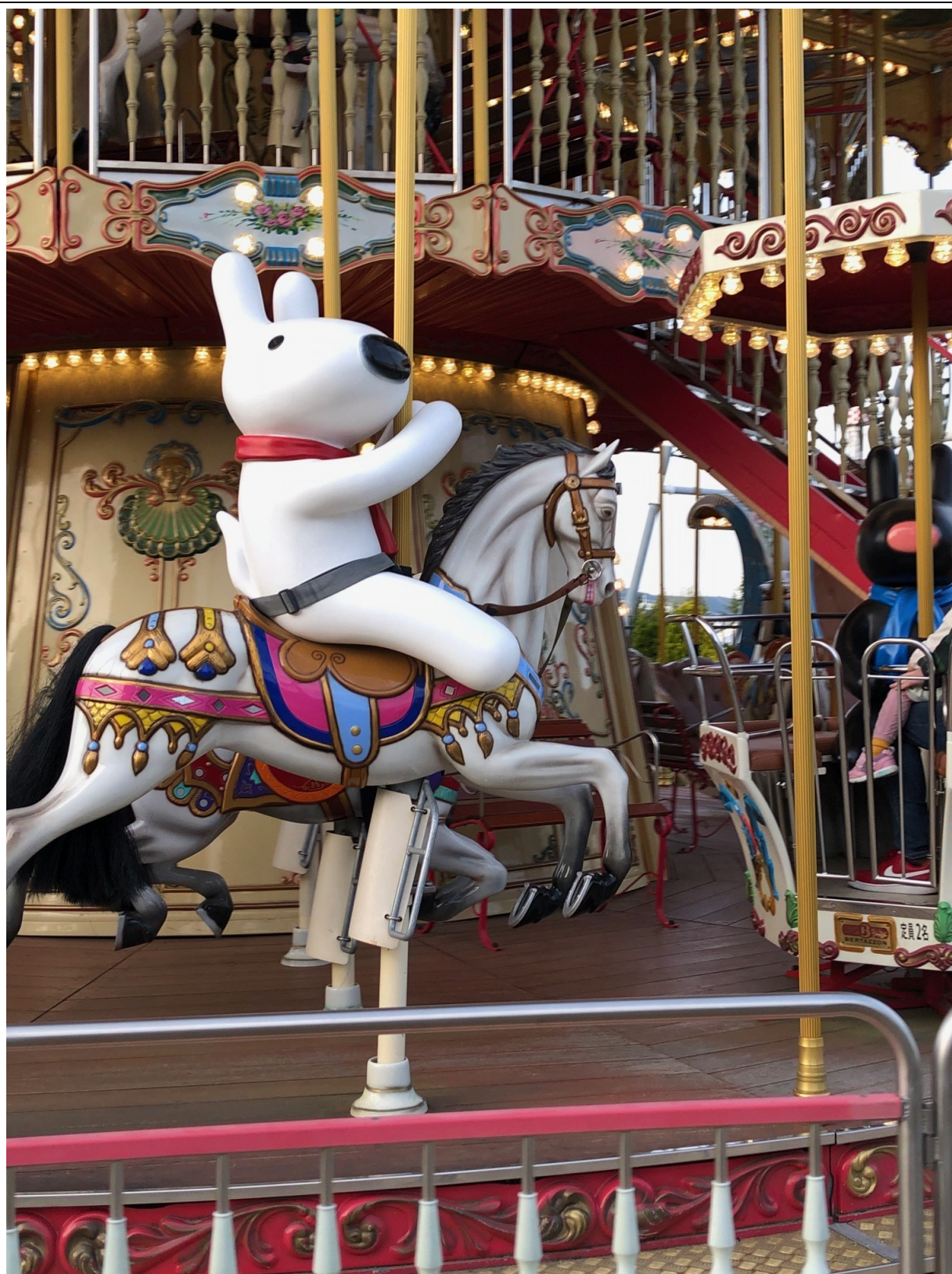
『メリーゴーランド』